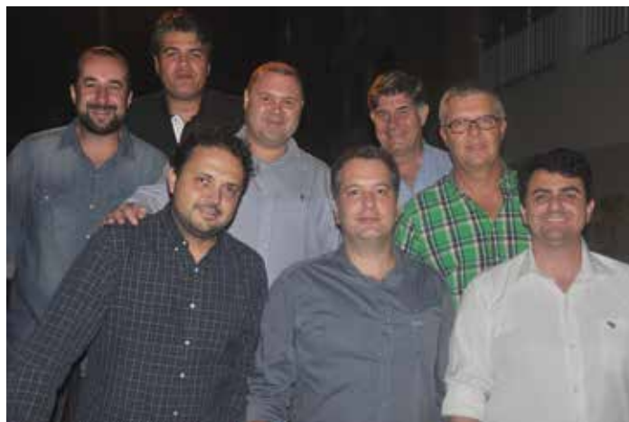
O clube do bolinha fez questão de se reunir à parte