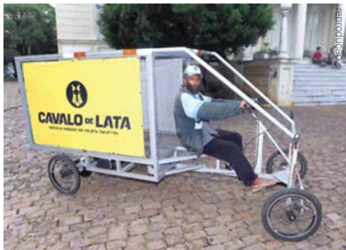
Um modelo de cavalo de lata