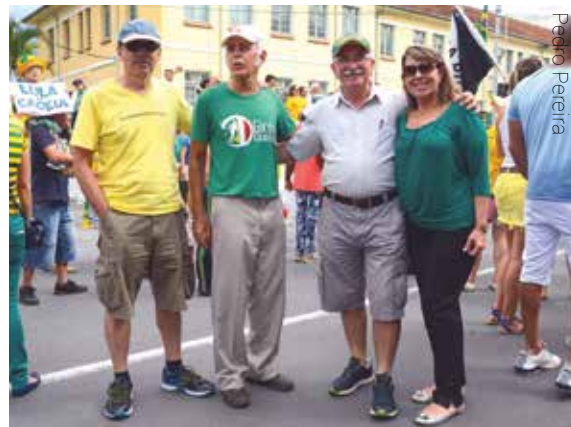
Taubateanos foram às ruas no domingo, 13