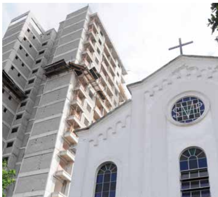
O valioso terreno da Casas Pias, na Rua 4 de Março, foi permutado com a construtora Ergplan em 2007