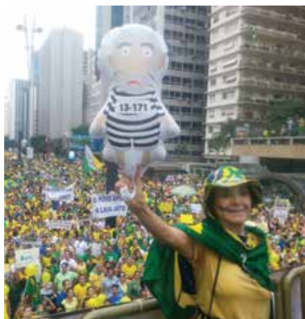
Manifestantes tomaram a avenida Paulista no domingo, à esquerda, e na quarta-feira, à noite