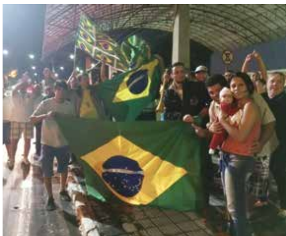
Municípios fazem vigília na avenida do Povo, em frente à Câmara, na quarta-feira, 16