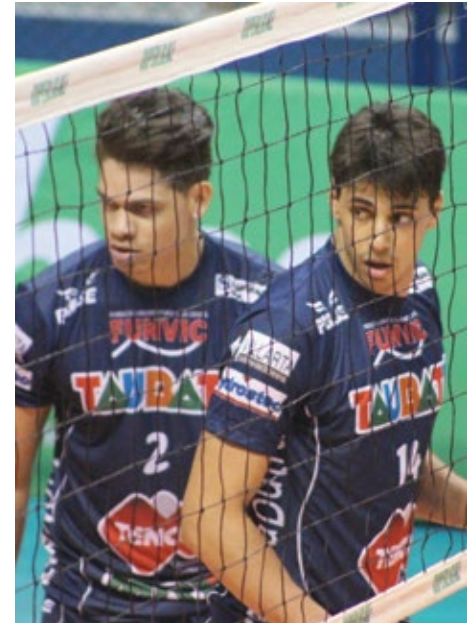
Taubaté Vôlei na briga pela liderança da Superliga

O Taubaté continua na liderança da Superliga Masculina de Vôlei, mas tem um grande desafio neste sábado, 19, fora de casa. A equipe irá enfrentar o Cruzeiro, vice-líder, em Contagem (MG) às 19h30 no ginásio do Riacho. Taubateanos e mineiros estão com 21 pontos no campeonato, sendo desempatados pelo número de setes.