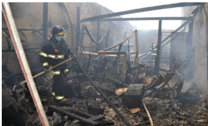
Depósito da loja de instrumentos musicais Kaito ficou destruído