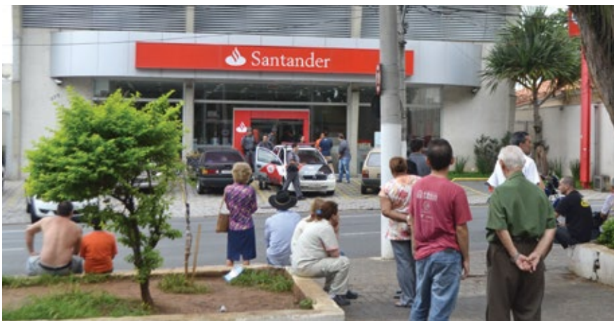
Frente da agência tomada por curiosos com a movimentação policial

Pelo menos três assaltantes participaram do assalto na segunda-feira, 30, por volta de 10h30; acionada, a Polícia Militar chegou depois que os bandidos já haviam fugido levando quantia ainda não informada.