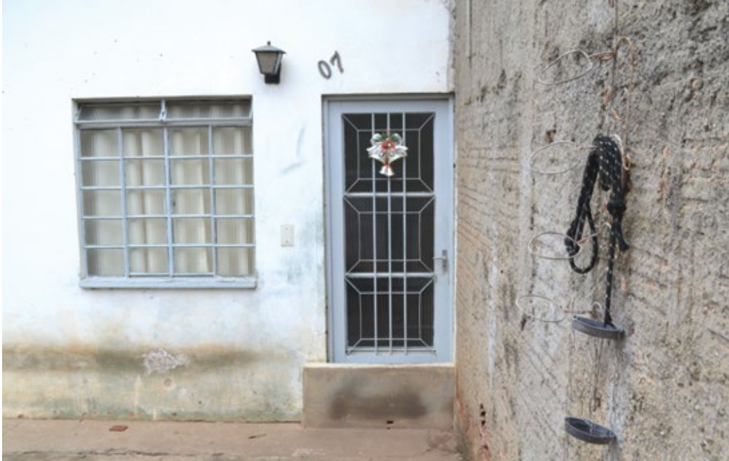
Moradores criam obstáculos em portas e portões na tentativa de diminuir os estragos causados pelas enchentes na avenida Manoel José Siqueira Mattos no Residencial Santo Antônio

Moradora há 18 anos no bairro denuncia que situação da avenida Manoel José de Siqueira Mattos só piora; no domingo, 29, bastaram 30 minutos de chuva para as casas se encherem de água com esgoto e lama; Prefeitura alega que não tem dinheiro para solucionar esse e outros problemas de enchentes.