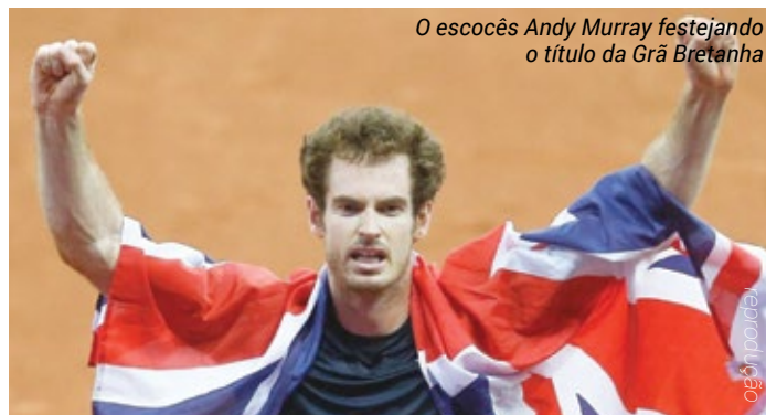
O escocês Andy Murray festejando o título da Grã Bretanha

A Taça Davis também foi fruto dos ingleses. O mais antigo torneio entre países foi jogado pela primeira vez em 1900, por conta de um desafio feito pelos americanos contra os ingleses, melhores jogadores do mundo à