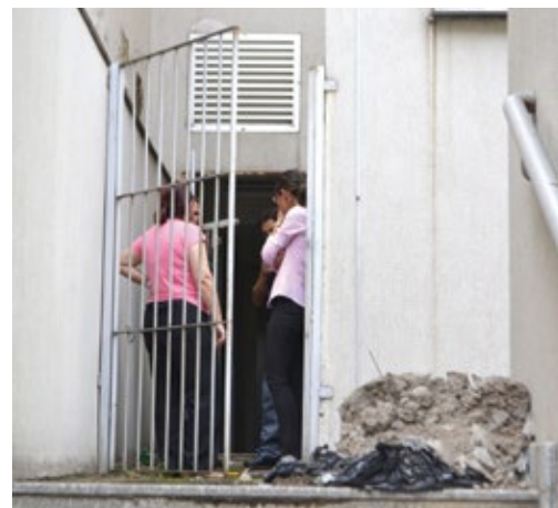
Funcionários conversando com policiais

C lientes da agência que utilizam os caixas eletrônicos na parte da frente da agência do Banco Santander localizada na praça Santa Terezinha nem chegaram a perceber a ação dos meliantes. Só souberam do assalto quando a Polícia Militar chegou por volta das 11h:00.