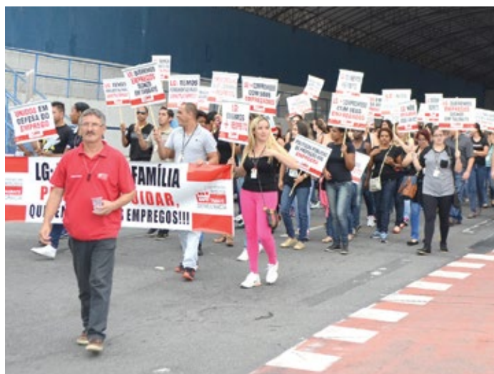
Manifestação passou pela avenida do Povo