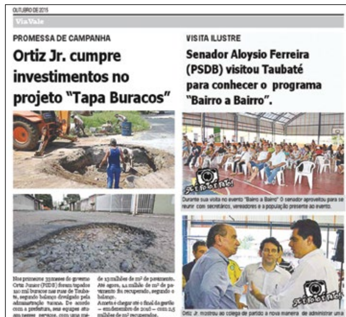
As vésperas de eleições municipais, alguns jornais assumem abertamente um compromisso com alguns possíveis candidatos e pirateiam descaradamente imagens de outros veículos