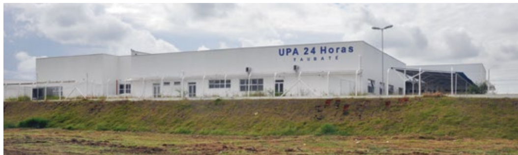
UPA San Marino é maior que o Pronto Socorro Municipal e está pronta desde o final de 2014

A UPA da Gurilândia com 1.300 m 2 é maior do que o Pronto Socorro Municipal. Grande parte dessa obra foi bancada com recursos do PAC 2 do governo federal. Embora concluída, a população da região continua sendo atendida em um prédio precário no Pronto Atendimento da Gurilândia, instalado em uma antiga