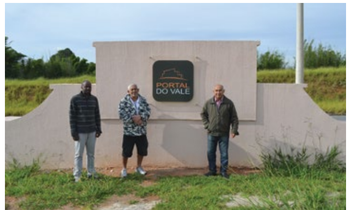
Compradores de terreno do loteamento Portal do Vale

Os moradores alertam a todos que por ventura venham a adquirir imóveis na cidade de Taubaté para que fiquem atentos a esse enorme detalhe. A compra de terreno na cidade pode acabar sendo uma arapuca para aprisionar contribuintes incautos por causa da ânsia da prefeitura em resolver seus problemas diante da propalada queda de receita. ●