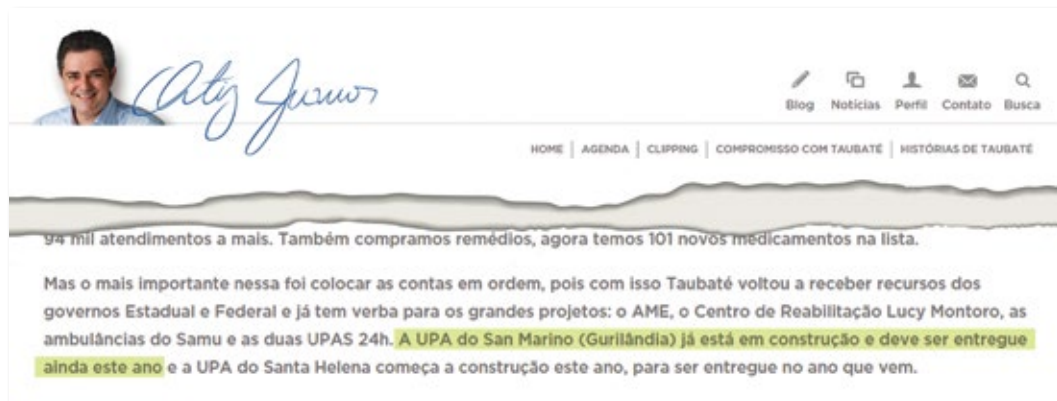
O que disse o prefeito, em trecho de notícia publicada no seu site oficial, em setembro de 2014

CONTATO torce para que não ocorram outros desencontros palacianos para que os moradores da Gurilândia possam dispor de unidade de saúde de mais qualidade dentro do prazo prometido pelo secretário da Saúde. E, claro, que ele não faça como o prefeito que não cumpriu com o prometido por escrito e sequer pediu desculpas. ●