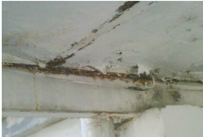
Marcas de infiltração e umidade tomam o teto da UTI Neonatal do HU