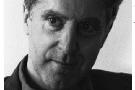
Jonathan Crary, ensaísta norte-americano

Em “Técnicas do observador – visão e modernidade no século XIX” o autor advoga a necessidade de olhares aptos à desnaturalização da lógica continuísta. Como quem duvida, Crary valoriza a pergunta pertinente, motivadora de desafios e de mudanças. Circunscrevendo o boom da tecno-