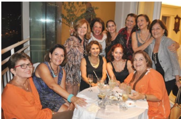
As amigas formaram um verdadeiro Clube da Luluzinha

Convidou os amigos mais próximos para comemorar o aniversário da mama com pratos preparados por ela