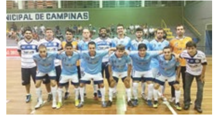
O time da ADC Ford Futsal/ Taubaté que venceu o Pulo do Gato em Campinas nessa terça

Invicta e com duas vitórias na Liga Paulista, a ADC Ford Futsal/ Taubaté volta a quadra neste sábado (21), às 19h, contra o São Paulo, no ginásio do Cemte. Será o primeiro duelo da temporada diante da torcida taubateana.