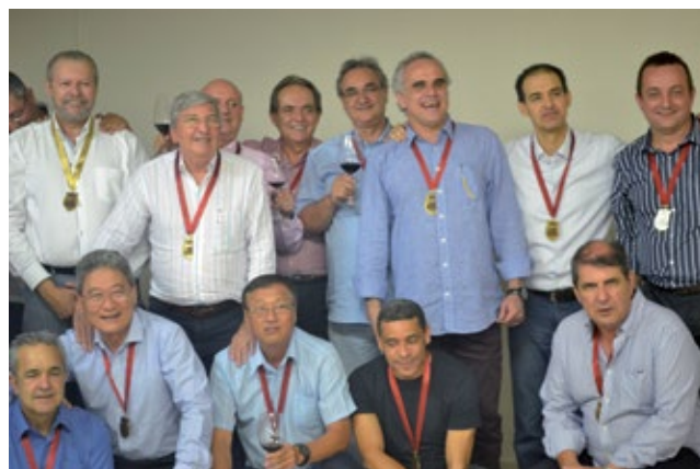
O time do Bolinha acabou perdendo o jogo para o time de suas metades