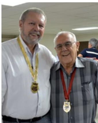
Essa dupla ouro e prata disputa o título de melhor contador de história