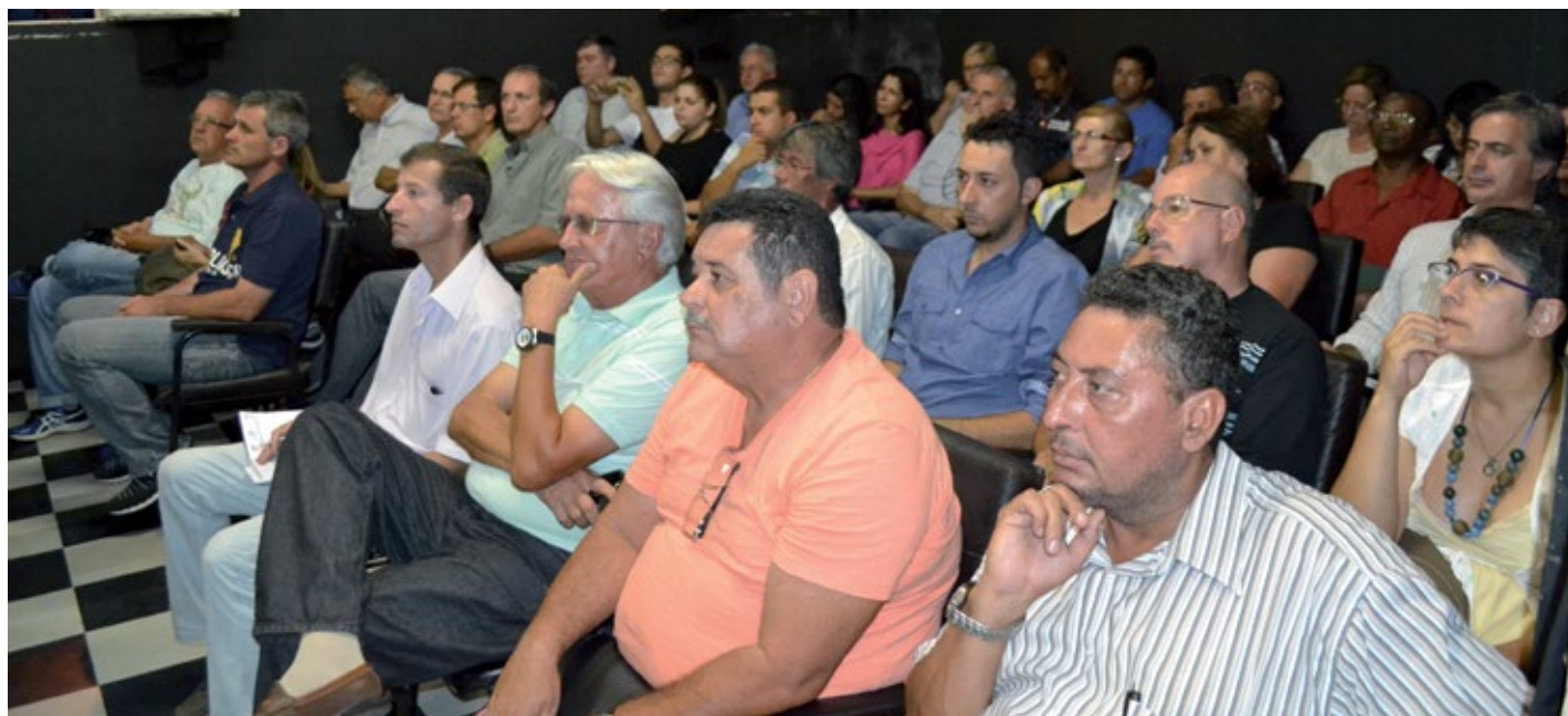
Público acompanha a apresentação do Planejamento no Centro Cultural sobre a revisão do Plano Diretor

Desde a aprovação do Estatuto da Cidade, denominação oficial da lei aprovada em julho de 2001, que regulamenta o capítulo "Política urbana" da Constituição brasileira, um Plano Diretor deve ser um instrumento que sintetiza e torna explícitos os objetivos e estabelece princípios, diretrizes e normas a serem utilizadas como base para que as decisões dos atores envolvidos no processo de desenvolvimento urbano converjam, tanto quanto possível, na direção desses objetivos