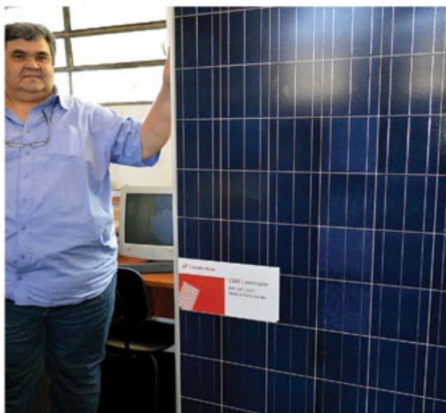
EQUIPAMENTOS SÃO FRUTO DE PARCERIA COM EMPRESA

Todos os equipamentos recebidos são novos e, entre eles, encontram-se: quatro placas fotovoltaicas, um sistema de proteção elétrica e contra descargas atmosféricas, mais um inversor (a empresa já havia doado um inversor anteriormente), acessórios e toda a estrutura para a