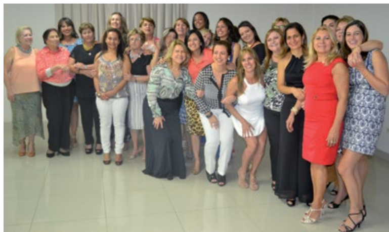
Eis uma prova de que as mulheres também sabem apreciar o bom vinho