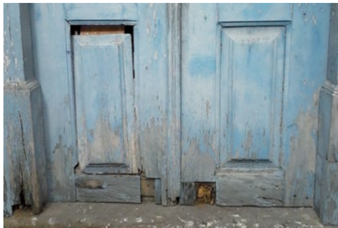
Estão previstas medidas emergenciais para impedir que desocupados e viciados voltem a ocupar a Capela do Pilar, o mais importante patrimônio histórico da cidade