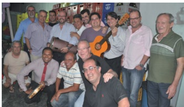
Olhem apenas uma amostra dos festeiros e algumas das caixas de cerveja consumidas rrsrs