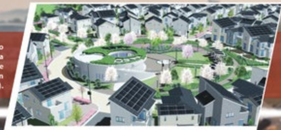
Representação do Fujisawa Sustainable Smart Town (SST).

Que seja então o glorioso Esporte Clube Taubaté o time que nos representará metropolitanamente. ●