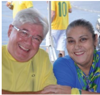
Clima ameno no Barril no intervalo do jogo