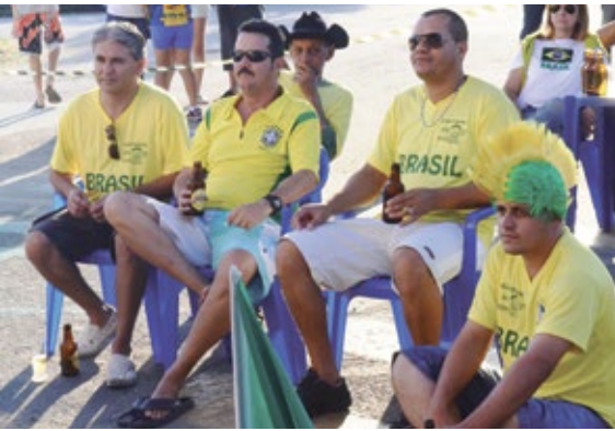
Uma imagem do desânimo que tomou conta do Quiririm

Seleção mexicana cala nossa torcida que estava preparada para uma noite de festas e comemorações na rota do hexa: bares, restaurantes e churrascos na casa dos amigos registraram o desapontamento que substituiu o grito de gol engasgado na garganta