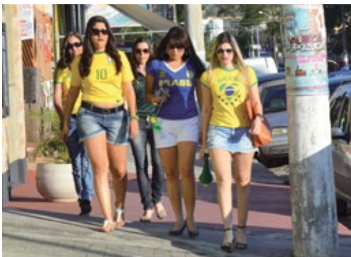
A tristeza estampada nas fisionomias caminha pela Avenida Itália