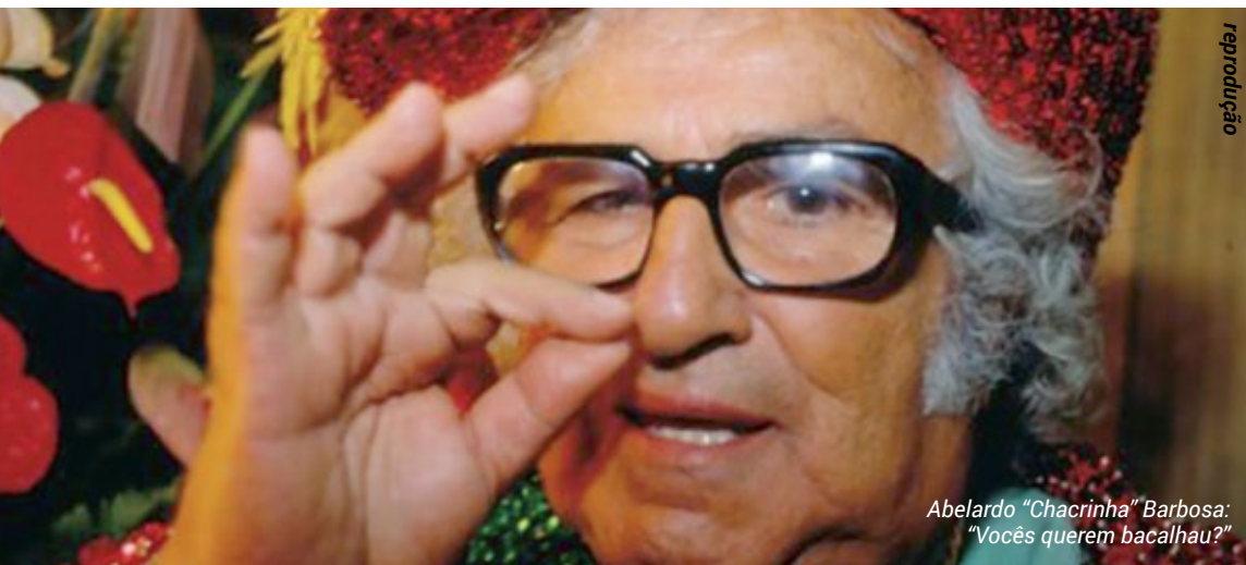
Abelardo "Chacrinha" Barbosa: "Vocês querem bacalhau?"

N a segunda-feira, 19, o Brasil acordou de ressaca. O mal-estar foi provocado pelo ministro do STF Teori Zavascki ao mandar soltar todos os presos pela Operação Lava Jato deflagrada no dia 17 de março pela Polícia Federal que prendeu Alberto Youssef sob acusação de comandar um esquema de lavagem de dinheiro que teria movimentado R$ 10 bilhões. Além dessa enorme fortuna, ele teria ramificações em partidos como o PT, PMDB, PP e SDD.