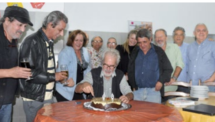
Um parte dos amigos que compareceram à convocação no Barril do Zé Bigode

O resto foi só alegria registrada com exclusividade por CONTATO e que também podem ser conferidas em www.facebook.com/jornal.contato ou no site www.jornalcontato.com.br •