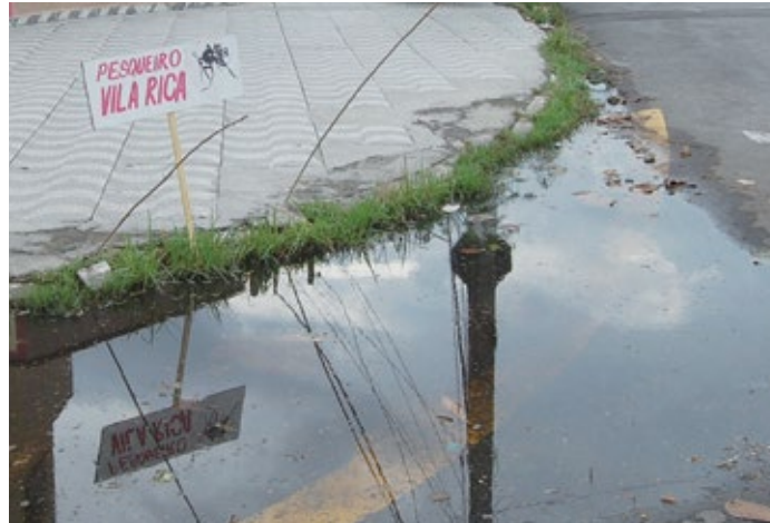
"Pesqueiro Vila Rica", protesto de moradores do bairro Vila Rica feito em 2011 continua atual

Vereadora Pollyana Gama (PPS) protocolou no dia da aber-