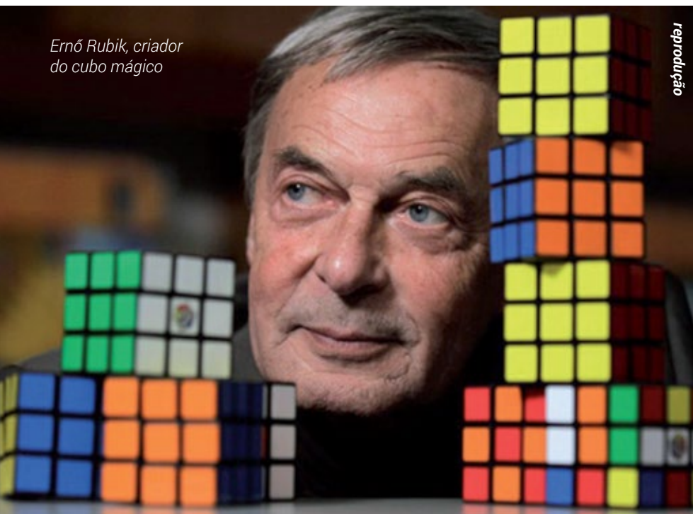
Erno Rubik, criador do cubo mágico

Davidson e a sua equipe começaram por dividir todas as possibilidades em 2.200 milhões de grupos, cada um com 20 bilhões de posições distintas. Inicialmente, descartaram todas as opções que poderia duplicar-se e usaram ainda a simetria para reduzir combinações idênticas.