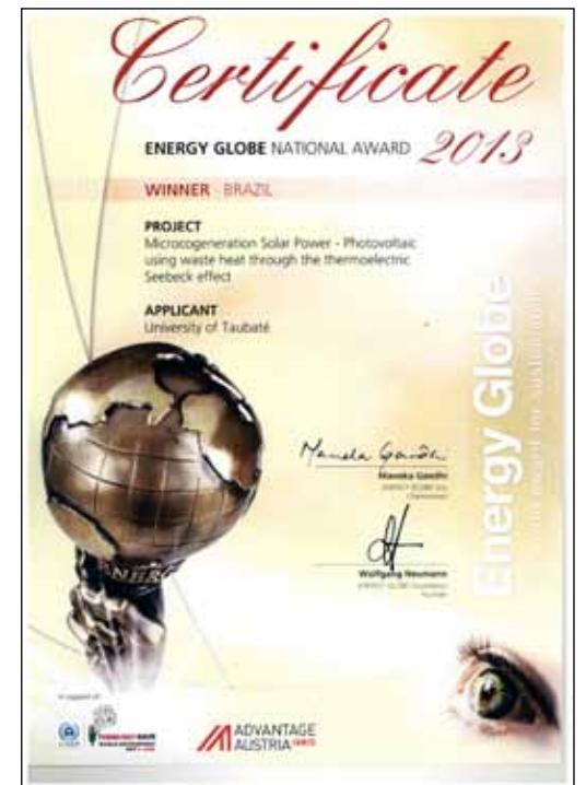
Certificado entregue na ocasião