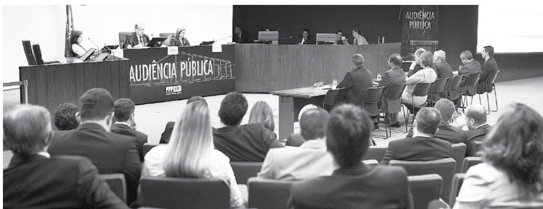
Audiência Pública realizada pelo Supremo Tribunal Federal e presidida pelo Ministro Gilmar Mendes

A ação foi proposta no dia 22 de maio com pedido de liminar. Mas até o fechamento desta edição não havia qualquer decisão do poder Judiciário. □