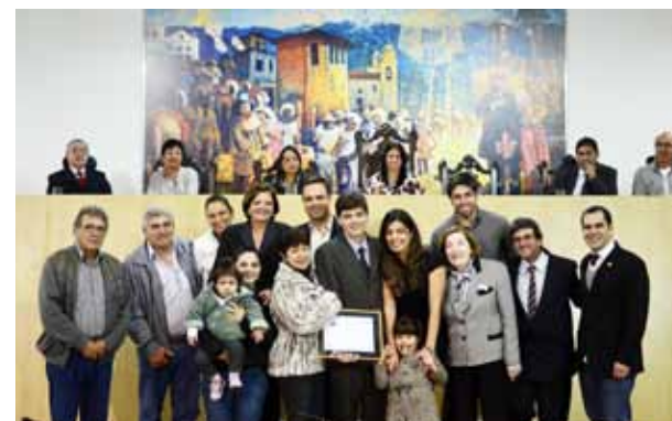
Familiares e amigos na foto oficial da solenidade