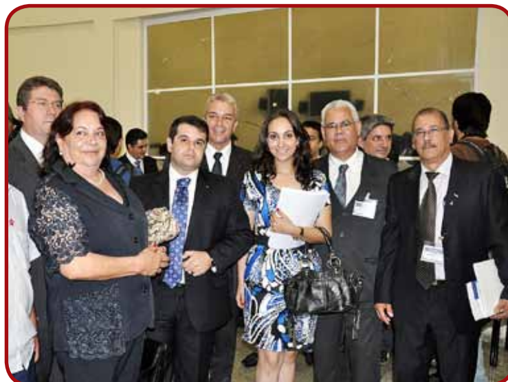
Comissão de Direito Eleitoral da OAB Taubaté no debate da TV Câmara