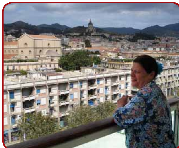
A chegada de navio na cidade siciliana de Messina, Itália