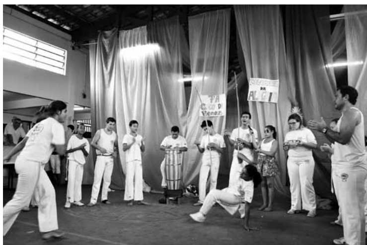
Apresentação de capoeira