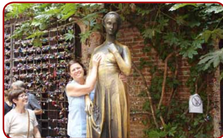
Segundo a tradição italiana, quem está sem um amor deve tocar a estátua de Julieta e fazer o pedido