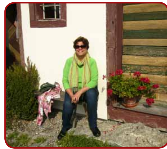
Em Wolfegg, Alemanha, onde existe uma cidade preservada com todas as características, do século 18 e 19