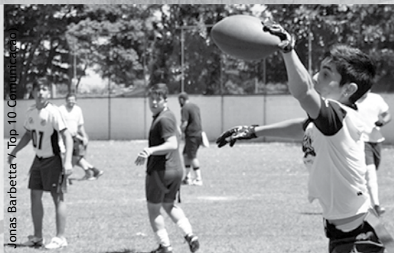
Jonas Barbeta / Top 10 Comunicação

Enquanto muitas dúvidas ficam na cabeça do torcedor, duas coisas já estão confirmadas. O Esporte Clube Taubaté vai participar da Copa São Paulo de Futebol Júnior e a cidade novamente deve ser uma das sedes da competição. E para o ano que vem vamos ter um novo "clássico". O