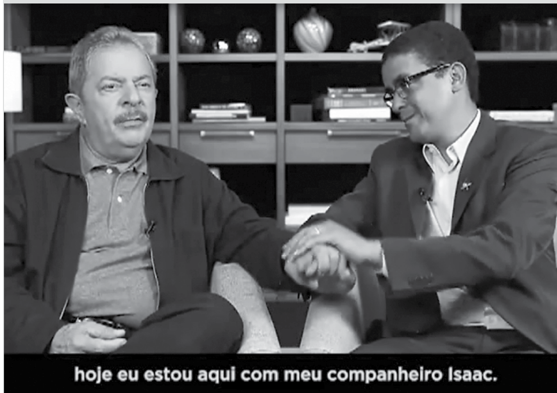
Lula (PT) na propaganda eleitoral gratuita na televisão com Isaac do Carmo (PT)

A entrada do ex-presidente Lula na campanha em Taubaté modificou o cenário ao polarizar a disputa entre o PT e o PSDB, desde o dia 14 de setembro, data em que apareceu pela primeira vez no programa de Isaac do Carmo. Até então, o candidato petista que disputava o 3º ou o 4º lugar, saltou para 2º, evoluindo de 10% para 21% nas intenções de votos, de acordo com a pesquisa IBOPE realizada a pedido da Rede Vanguarda.