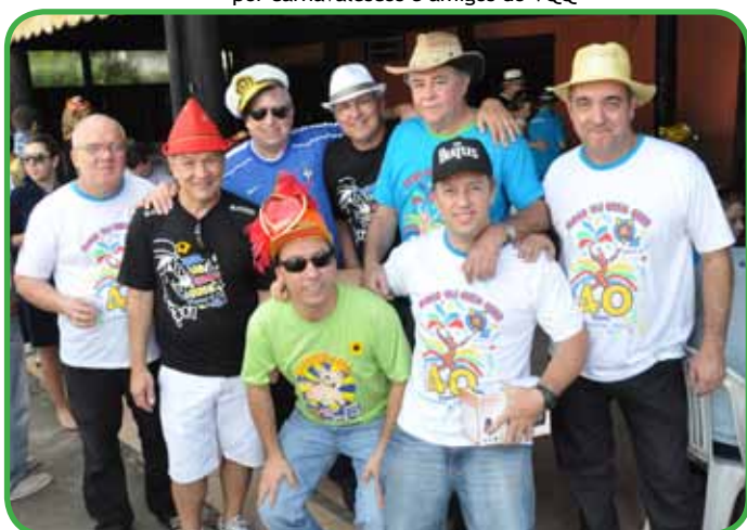
Oito dos dez diretores da VQQ