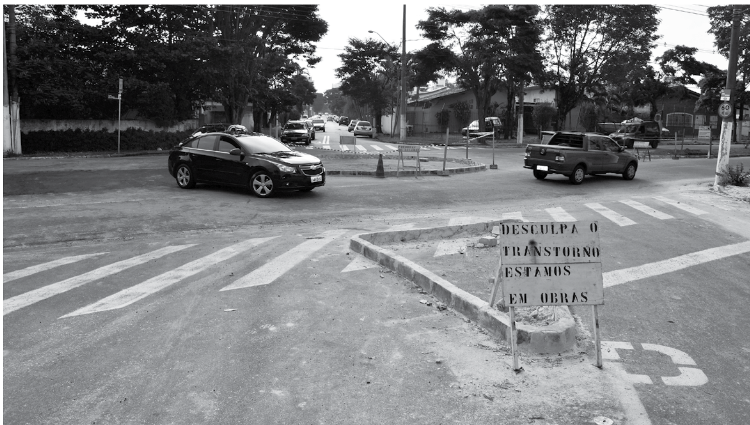
Acima: rotatória no meio da Av. John Kennedy. A obra avançou sobre duas faixas de veículos na via pública. O canteiro construído também avançou sobre a faixa de pedestre. Abaixo: servidores destróem a rotatória e iniciam a construção de um retorno

Na falta de política pública para o setor, a prefeitura realiza obras pontuais e medidas paliativas para tentar resolver o problema do trânsito na terra de Lobato, iniciativas que não resolvem a situação da urbe