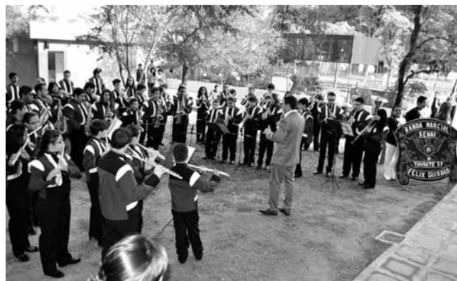
Apresentação da Banda Marcial do SENAI