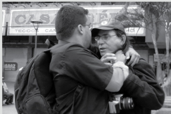
Depois de tentar tomar a máquina fotográfica do manifestante, o homem que defendia o prefeito foi agarrado pelo pescoço