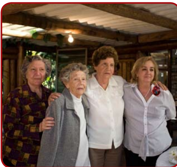
... e amigas após a aula