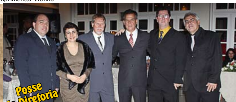
Posse da Diretoria