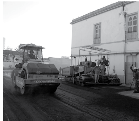
Obras de ampliação do estacionamento ao lado da Igreja do Rosário; desrespeito ao monumento que está fechado por risco de desabamento

das até a Fundação Dom Couto, mas nenhuma providência foi tomada.