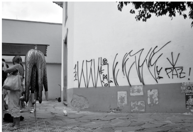
Registro da falta de respeito, educação e principalmente da falta de autoridade, em 18 de maio de 2011, na Capela do Pilar

É o caso da Capela do Pilar e também da Igreja do Rosário. Reiteradamente temos denunciado as agressões e o abandono em que se encontra a Capela do Pilar, com instalação de barracas e encostadas na parede, ligações clandestinas de luz, paredes de taipa descascando e com pichações, janelas e portas fechadas o tempo todo, o que leva à deterioração mais rápida do prédio, entre outros descasos. As denúncias foram leva-