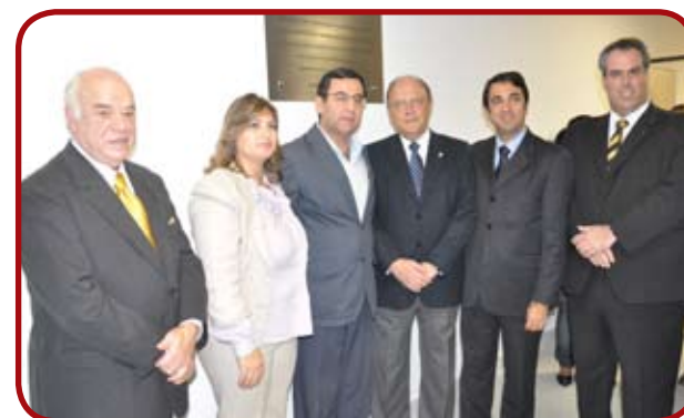
Alto comando do CIEE nacional prestigiando a inauguração da sua nova unidade em Taubaté