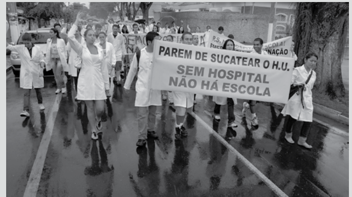
Manifestação dos estudantes de Medicina em 2008

O curso de Medicina da Universidade de Taubaté (UNITAU), que completa 44 anos em 2011, é o único da região do Vale do Paraíba. Nessa história, o Hospital Universitário de Taubaté (HUT) é ponto importante e interfere diretamente na qualidade do ensino. Além da formação em diversas áreas da saúde, o HUT tem por função prestar assistência médico-hospitalar à população, tornando-se referência para toda a região, inclusive o Sul de Minas Gerais.