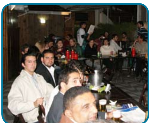
Evento reuniu cerca de 40 empresários no Resenha Lounge Bar