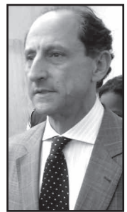
Paulo Skaf (Fiesp)