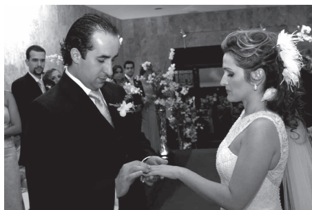
Momento sério, delicado e sublime