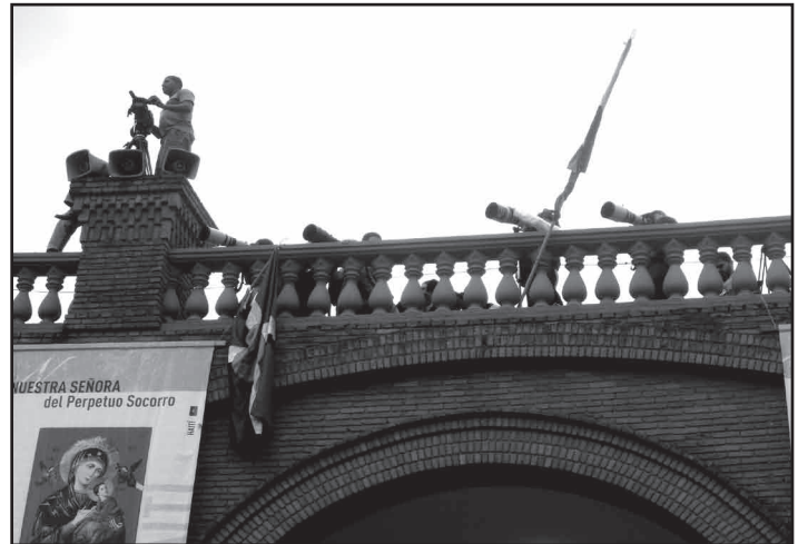
Papa se despede dos fiéis. Alguns dormiram no pátio da Basílica para conseguir ficar mais próximo do altar; imprensa usa toda tecnologia e ousadia para registrar a missa dominical

No dia 13 de maio, Bento XVI fez uma histórica missa campal no pátio da Basílica Nossa Senhora Aparecida. A expectativa era receber 500 mil fiéis, mas o comparecimento de apenas 150 mil não tirou o brilho do evento, que contou com a participação de autoridades e políticos.