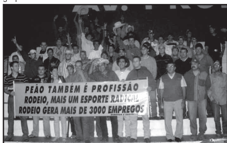
A "peãozada" fez a festa no final da sessão.

Na terça-feira, 15, na última sessão da Câmara Municipal de Taubaté, o plenário esteve lotado. De um lado, os defensores da causa dos animais, que levantavam faixas onde pediam a proibição da prática do rodeio em Taubaté. Do outro, devidamente trajados, com bota, cinto, camisa típica de peão e, claro, chapéu, estavam os que defendiam o rodeio na cidade.